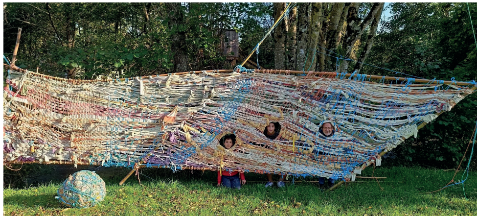
L'œuvre plastique collective et participative "Tissons nos différences"

Ouvert à tous : que vous soyez un habitant de la cité, un visiteur de passage, un curieux, ou simplement quelqu'un souhaitant découvrir ou contribuer à une création artistique, cet atelier vous accueille chaleureusement. Aucune expérience en art n'est nécessaire, seulement l'envie de partager un moment collectif et créatif !