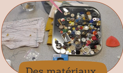
Des matériaux de récup'...