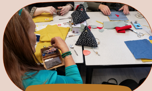
De la solidarité...