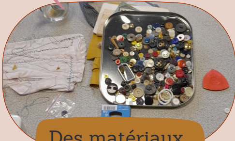
Des matériaux de récup'...