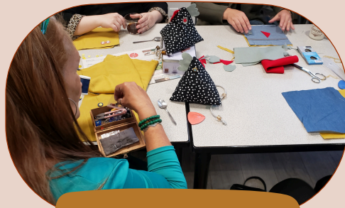
De la solidarité...